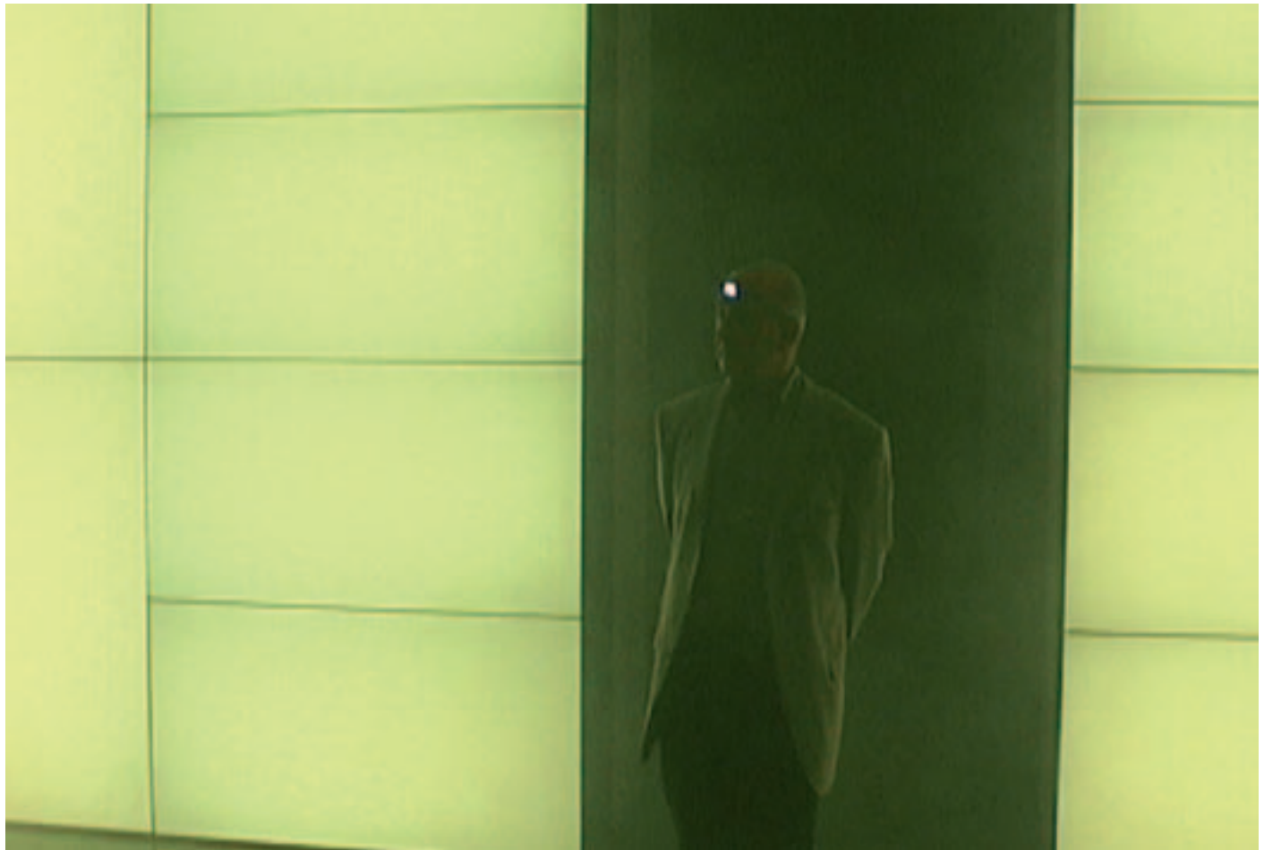
›Mehr Licht‹. Intervention in der Ausstellung ›Lichtecht‹ im Museum für Gestaltung Zürich