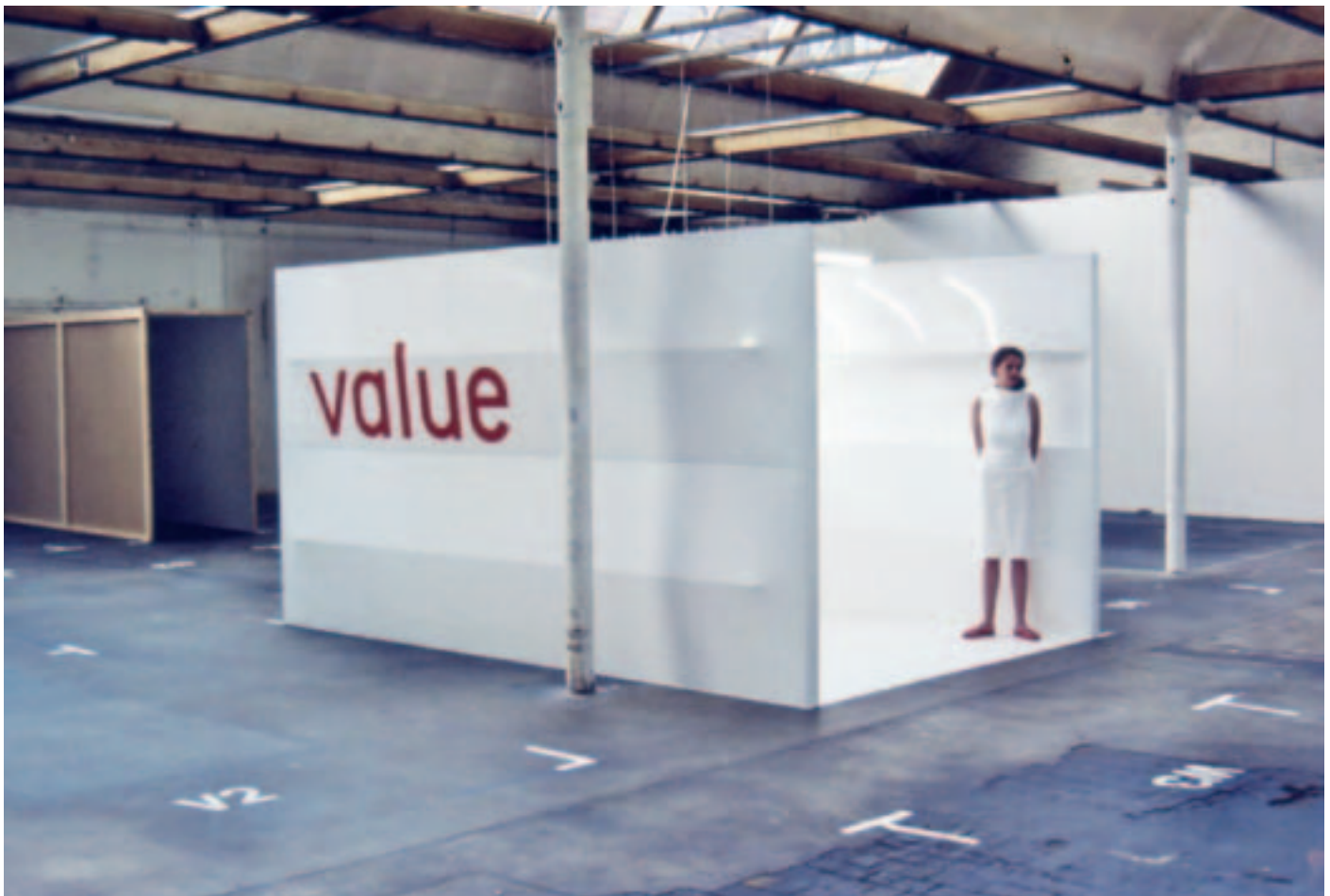
›value-Konzepte zur Wertsteigerung‹. Einzelausstellung und Präsentation des Unternehmens value mit Stand- hostess im Kunstkontext