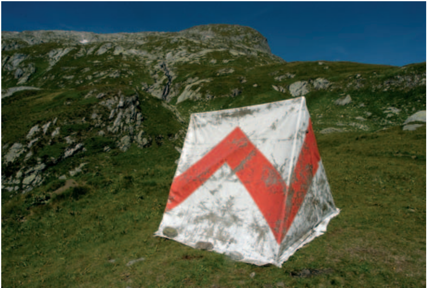
›Greina-Grabung‹. Die Intervention in der hochalpinen Landschaft wurde mit dem 2. Jurypreis ausgezeichnet.

In der Ausstellung ›Tell, bitte melden!‹ im Forum der Schweizer Geschichte in Schwyz anlässlich des Jubiläums 200 Jahre Schillers ›Wilhelm Tell‹ haben wir ebenso die Szenografie und Gestaltung ausgeführt wie auch die künstlerische Leitung und Kuration der Beiträge von Schweizer Gegenwartskünstlern übernommen. Zusätzlich haben wir eine eigene Kunstinstallation im Rahmen dieser Ausstellung realisiert.