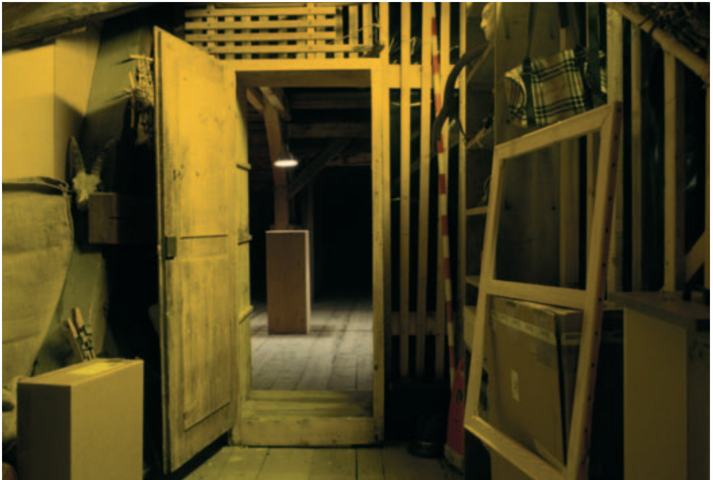
›Collecziun Engiadina‹. Der Dachboden als Metapher und Erinnerungsraum

schungsarbeit setzt in diesem Spannungsfeld an und lässt als Ergebnis gedankenräumliche Ausdrucksformen entstehen.